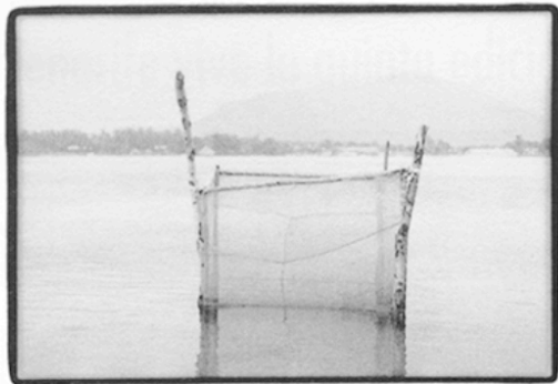
© Elena García Juan. Ganadora del primer premio en el concurso de portfolios.